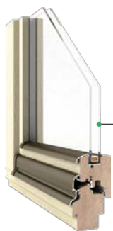
Classic DJ 68