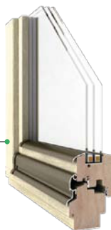
Comfort DJ 78