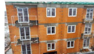
Książenice k. Radziejowic. Osiedle mieszkaniowe.