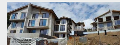
Szklarska Poręba - 36 apartamentów.