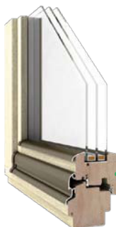
Premium Thermo DJ 92